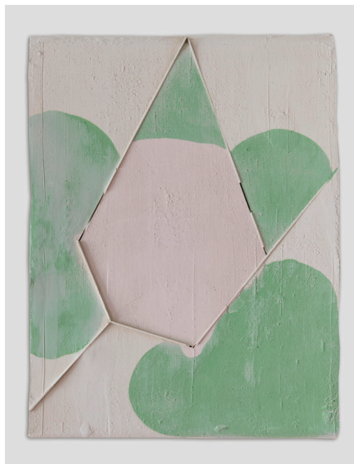
Ohne Titel (Zones), 2021, Gips, Tusche, Filz