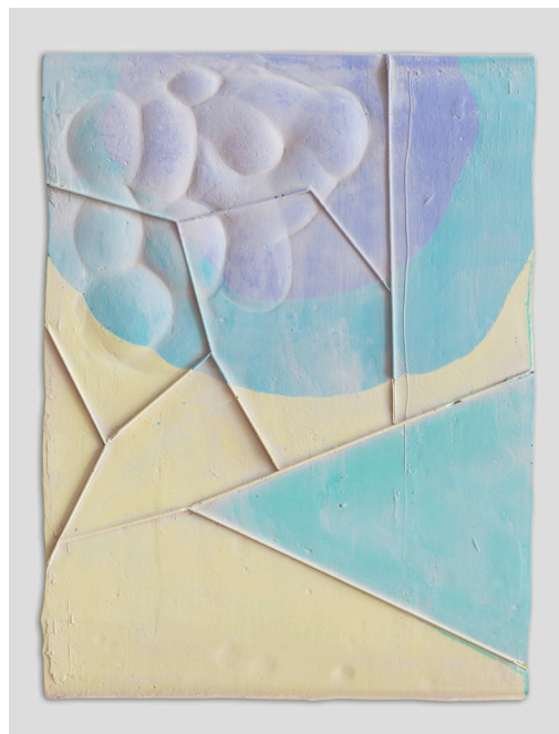
Ohne Titel (Zones), 2021, Gips, Tusche, Filz

Andrea Heller, 1975 in Zürich geboren, lebt und arbeitet in Evilard und Biel/Bienne in der Schweiz. Sie studierte an der Hochschule für Bildende Künste in Hamburg (HfbK) und an der Hochschule der Künste (zhdk) in Zürich. Ihre Werke werden in angesehenen Museen und Galerien in Einzel- und Gruppenausstellungen gezeigt. Grosse Beachtung fand ihre fulminante Einzelausstellung 2019 im Kunsthaus Centre d'art Pasquart in Biel/Bienne, zu der auch ein umfassender Katalog erschienen ist.